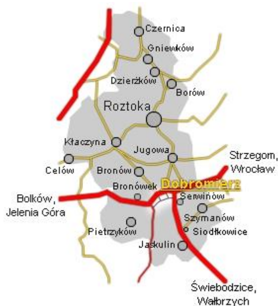
Mapa Gminy Dobromierz